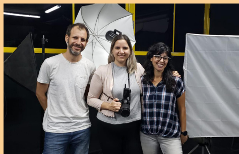
חלק ממשתתפי המיזם בחדרה