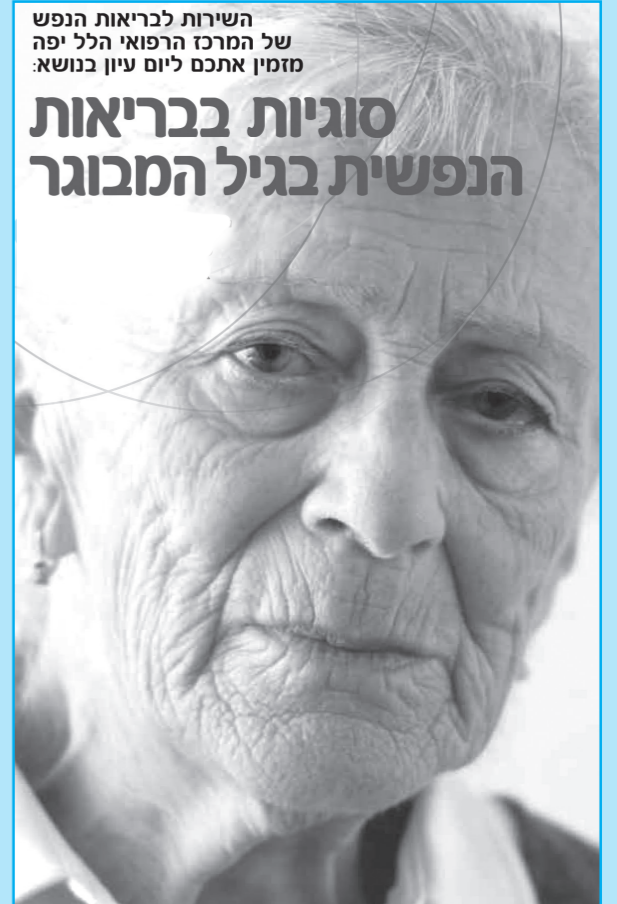
השירות לבריאות הנפש של המרכז הרפואי הלל יפה מזמין אתכם ליום עיון בנושא:

האודיטוריום במרכז הרפואי "הלל יפה" היה גדוש מפה אל