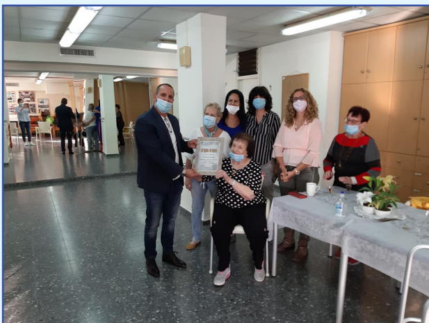
הענקת תעודה לתורמים

המועדון מהווה בית לגמלאים. הוא שוקק פעילויות מגוונות: חוגים, מועדונים חברתיים ומועדון "קפה אירופה" לניצולי שואה. במועדון מתקיימים גם מיזמים המשותפים לעמותה ולאגף הרווחה, המחלקה לאזרחים הוותיקים בעיריית חדרה. תודתנו נתונה לכל התורמים על פתיחות הלב, ואנו מצפים לשיתופי פעולה בהמשך הדרך.