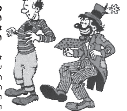
בגתן ותרש על משמרתם