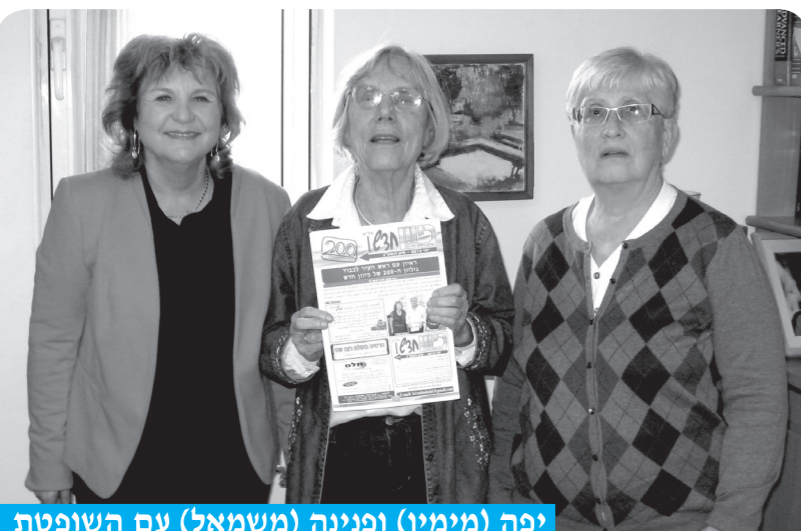
יפה (מימין) ופנינה (משמאל) עם השופטת

כמובן, כגמלאיות אל גמלאית השאלה הראשונה שלנו הייתה איך מרגישה גמלאית? "אני מצטערת מאוד, אני לא כל כך פנסיונרית. קיבלתי החלטה אסטרטגית, שאינני רוצה לעסוק במה שקוראים 'לביתי'. אני החלטתי לעסוק במה שאני רוצה וזה קידום זכויות האדם. אני מלמדת באוניברסיטת בר-אילן שני סמינריונים לזכויות האדם ובאוניברסיטה העברית אני מלמדת משפט חוקתי את תלמידי המדעים. חשוב להגיע לאנשים שבדרך כלל לא לומדים את זה. עיסוקי הנוספים הם: אני בוועד המנהל של האוניברסיטה העברית, חברה בחבר הנאמנים של ביה"ס למינהל, אני מרצה בארץ ובחו"ל ואיני גובה עבורן שכר, אני פעילה במכון לדמוקרטיה, אני גם נשיאת מועצת העיתונות. כפי שענייכם רואות אני מאוד עסוקה מנטאלית ופיזית. לשאלתכן מה אני ממליצה לגמלאים, ובכן אני מאוד ממליצה להם להיות פעילים, בהתנדבות בעיקר. יש כל כך הרבה דברים שאתם יכולים לעשות. באמת במדינתנו מאות אנשים עושים דברים נפלאים בהתנדבות, ואם עושים זאת, זה נותן סיפוק אישי, וזה מאריך חיים."