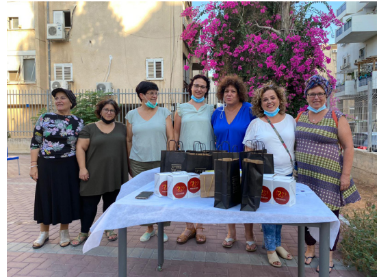
מתנדבות "בראש מורם"

בישראל כ-200 אלף נשים מוכות, ו-500 אלף ילדים עדים לאלימות קשה במשפחה. מספרן של המשפחות בסיכון שעוברות למקלט לנשים מוכות נמוך. הן נמלטות מבתיהן בחופזה ובחוסר כול, רק עם תיק קטן למקלט מרוחק מאזור מגוריהן ומבני משפחתן. המקלט הוא שירות חירום המציל חיים.