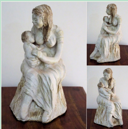
הדס קריצמן אישה פנים רבות לה

"חפש את האישה" הוא משפט ששמענו רבות בסרטי בילוש צרפתיים. אם נחשוב קצת נראה שזה נכון תמיד. האישה מעורבת ברקע, אבל משפיעה מאד. חוה אימנו נתנה את התפוח לאדם וגרמה מהפך וגירוש מגן עדן. רבקה בחרה ביעקב לקבל את הברכה מיצחק אביו למרות רצון האב. יעל הרגה את סיסרא והכריעה בכך את המלחמה. מי המציא את החקלאות אם לא הנשים, שהזרעים נבטו בחצר שלהן? גם בתולדות ההתיישבות החדשה בארץ יש תפקיד מכובד לנשים. ונשות חדרה הטביעו ועדיין מטביעות את חותמן על היישוב בתחומים רבים.