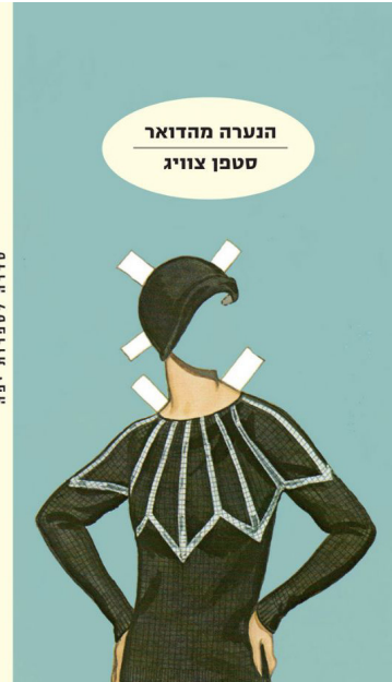
הנערה מהדואר סטפאן צווייג

הספר "הנערה מהדואר" נכתב לפני 90 שנה אבל התגלה בעיזבונו של הסופר היהודי אוסטרי, סטפאן צווייג, 40 שנה לאחר מותו, ועדיין רלוונטי. הספר עוסק במעמד הנמוך ובגורל הידוע מראש שלו. מתאים לימינו באופן כל כך קולע, שקשה להאמין שעיתוי תרגומו לעברית בשנת 2013 בתקופת המחאה החברתית הוא מקרי. עם פרוץ מלחמת העולם הראשונה התנדב הסופר לצבא. בספר הוא נותן ביטוי להשפעת השרות על האזרח הקטן.