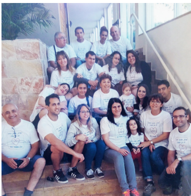
השבת עם סביג

"באחד הימים הגיע אל המחנה בן אדם, אני חושבת שהוא היה כומר, וחיפש חייטים ותופרות לתפירת מדים לצבא. אימא התנדבה יחד איתנו כמובן וכך הגענו למתפרה, שהייתה פעם בית חרושת לתרופות. אנחנו הילדים היינו כל הזמן במרתף ולמעלה המבוגרים עבדו. מכיוון שהייתי הגדולה שם מכול הילדים, היו בינינו הרבה תינוקות, הוטלה עלי משימה עם תום