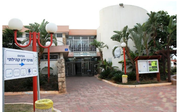
מתנ"ס גבעת אולגה

הרובד החמישי הוא גבעת אולגה ד' שבנייתו החלה בשנת 1960 והוא נועד לקליטת אחרוני התושבים של מעברת אגרובנק.