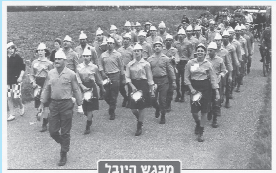
מפגש היובל לצועדי מפעלי נייר חדרה, 18.3.2015