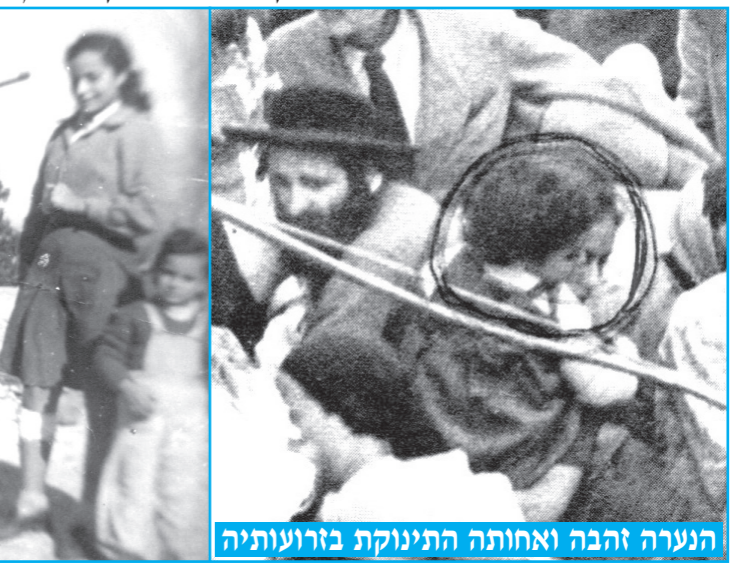
הנערה זהבה ואחותה התינוקת בזרועותיה