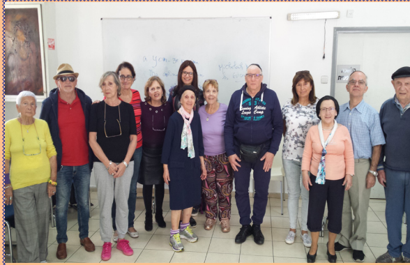
המשך עמ' 2