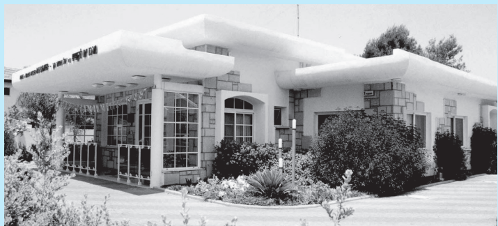
מרכז בקר רח' חנקין 7 טל. 04-6345856